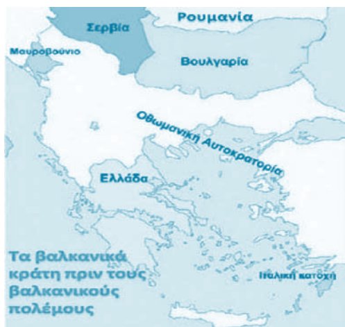
Χάρτης 1. Η Βαλκανική πριν τους Βαλκανικούς Πολέμους τοῦ 1912-1913

Πλέον ἐνεργές κατέστησαν οἱ σχέσεις –μὲ τὴ μεσολάβηση τῆς Ρωσίας– μεταξὺ τῆς Σερβίας καὶ τῆς Βουλγαρίας. Ἀρχῆς τοῦ 1912 ὑπεγράφη στὴ Σόφια μυστικὴ συμφωνία μεταξύ τους, ποὺ ἀργότερα συμπληρώθηκε καὶ μὲ στρατιωτικὴ σχεδίαση γιὰ πόλεμο κατὰ τῆς Ὀθωμανικῆς Αὐτοκρατορίας, στὴν ὁποία σχεδίαση ὑπῆρχαν καὶ προβλέψεις γιὰ διανομὴ ἐδαφῶν.